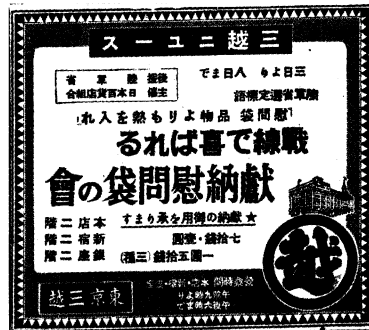
図9 献納慰問袋の会の広告

「[広告] 戦線で喜ばれる献納慰問袋の会／東京三越」(『読売』昭和14年10月3日夕刊2面)