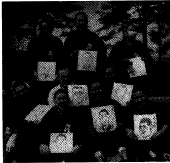
「奇襲漫画慰問団」(『写真週報』昭和16年3月26日第161号18-19頁)