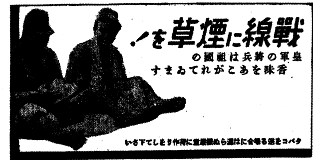
図10 慰問袋に入れる煙草の広告

また慰問袋は内地と戦地を精神的にも繋ぐ役割を果たしており、慰問袋が結ぶ縁も多くあったという。戦地の兵士が見ず知らずの内地の女性から慰問袋を送られたことをきっかけに交流を重ね、恋愛関係に発展したという話 74) も少なからずメディアに取り上げられている。また内地の子供からの心の籠った慰問袋に感