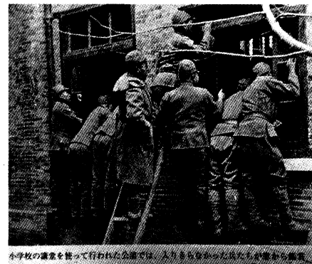
早坂隆「戦時演芸慰問団「わらわし隊」の記録——芸人たちが見た日中戦争」（中央公論新社、平成20年）