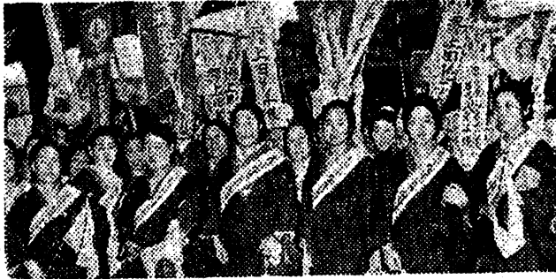
図2 皇軍慰問から帰った愛国婦人会会員たち