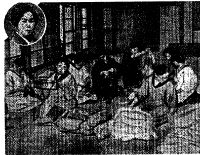
《労働新聞》員會婦日るす仕奉て場工場川化氣本日旬中月先 「異郷で身に沁む母の愛 少年工感謝集 増産 でご報恩 勤勞奉仕日婦會員へ感想文」(『読 売』昭和17年12月22日朝刊3面)

演芸型慰問団の要素も持っていたが、徴兵や軍事動員によって男手が足りない農村の託児所に向向き、日中働く母親たちの代わりに子供たちに紙芝居を読み聞かせたり一緒に遊ぶ活動も行っていた 28) 。